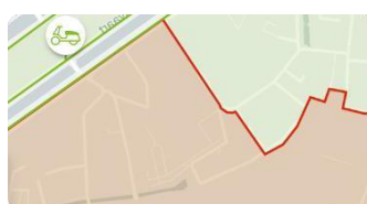
Geen parkeergebied (rood)