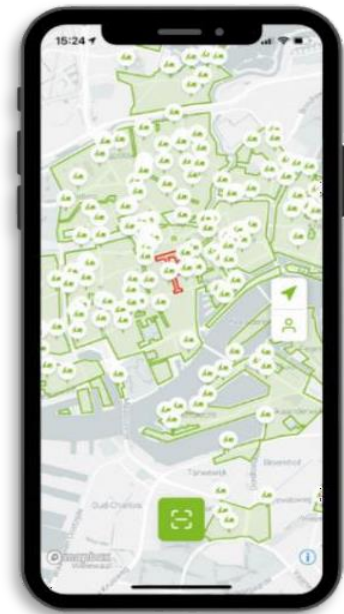
Voorbeeld uit app, servicegebied in de stad Rotterdam. Na registratie ziet de gebruiker zijn eigen locatie en het omliggende gebied

Na succesvolle registratie kan de gebruiker een e-scooter in de buurt reserveren, vervolgens heeft hij/zij 15 minuten om erheen te lopen en de scooter te starten door in de app op 'Start' te klikken. Het starten van een scooter is ook mogelijk door de QR code op het stuur te scannen en vervolgens gelijk te gaan rijden.